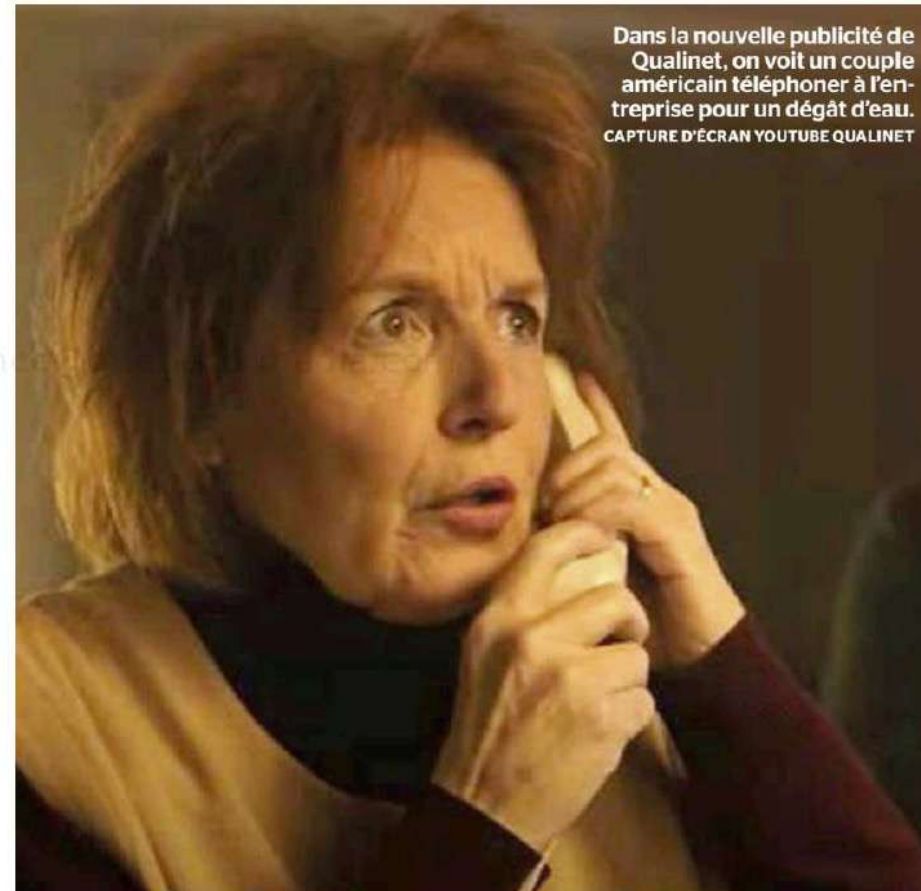
Dans la nouvelle publicité de Qualinet, on voit un couple américain téléphoner à l'entreprise pour un dégât d'eau.