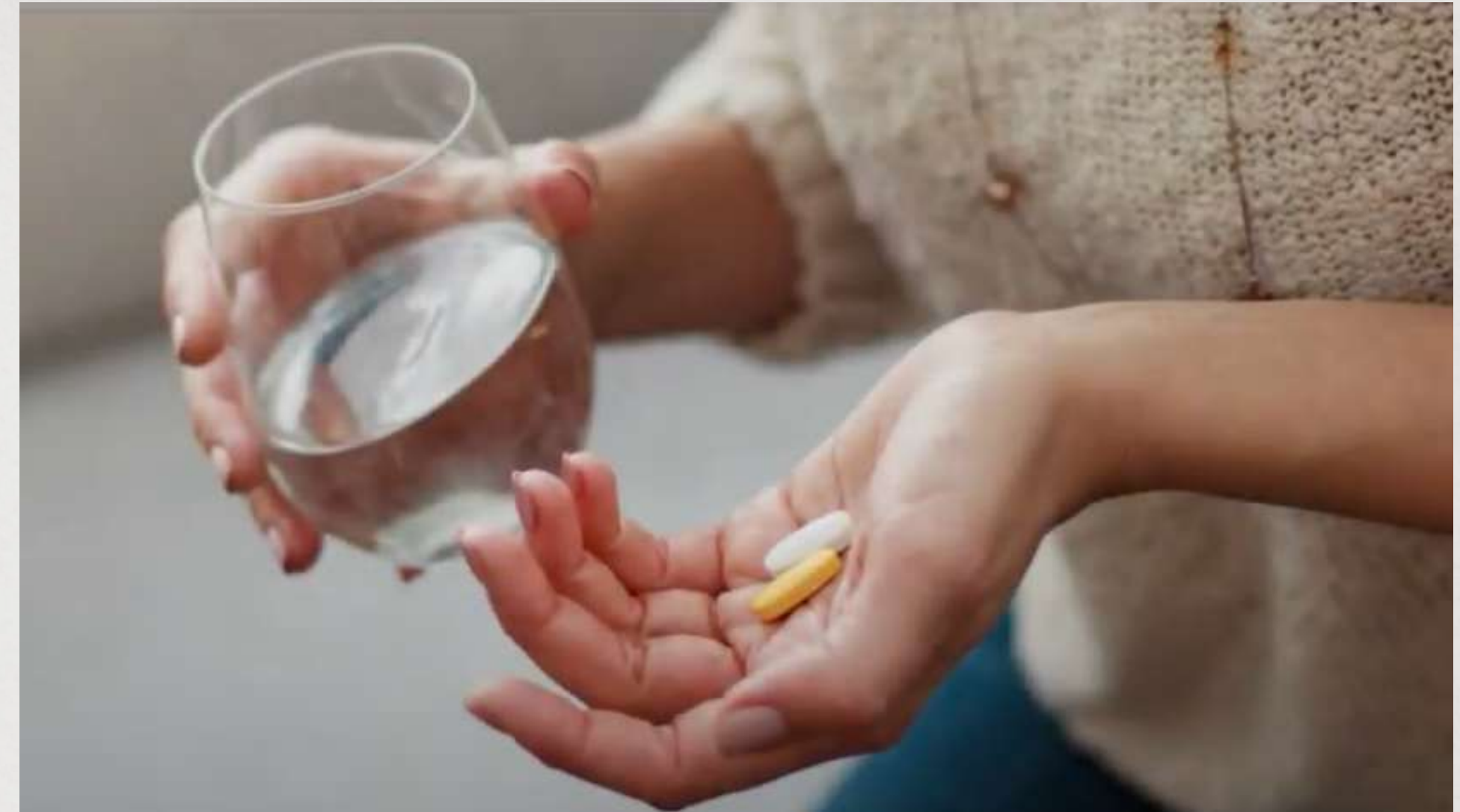
Commercial Voice Demo